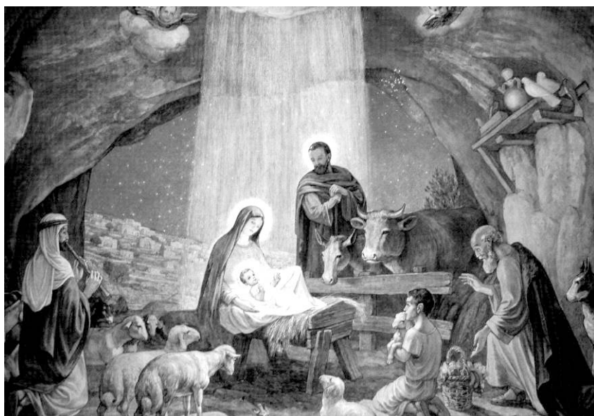
Mural de la Navidad en el Campo de los Pastores de Belén

Todos los años la Virgen María nos regala un mensaje de Navidad, en la Nochebuena. Eso nos demuestra la importancia que Ella da a este acontecimiento. ¡Qué madre no recuerda con emoción y alegría el nacimiento de todos sus hijos! Nos quiere hacer contemplar cómo lo vivió Ella, qué significó la pobreza de la cueva, las puertas que se cerraron en los vecinos de Belén, el cariño y el buen hacer de San José, la manifestación de todo el cielo presente en esa gruta, la alegría y sencillez de los pastores aportando sus pobres presentes.